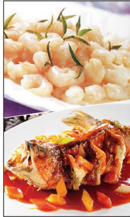
蘇杭美食匯聚 Hangzhou Delicacies Delight