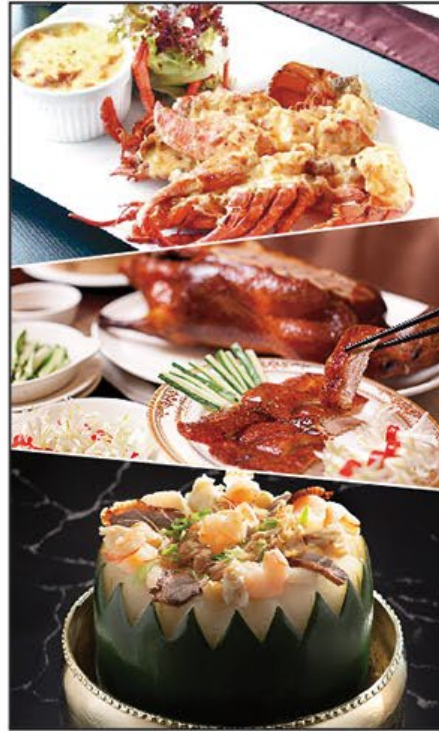
寶鼎龍皇宴 Summer Special Set Menu