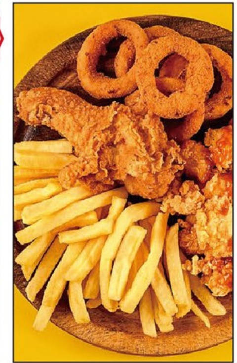
休閒小食拼盤 Snacks Promotion