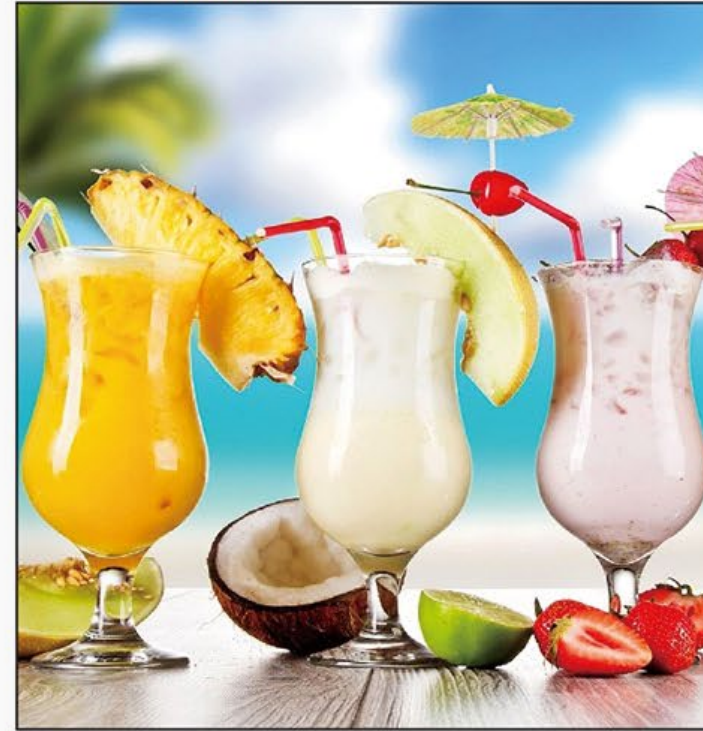
夏日特飲 Summer Drinks