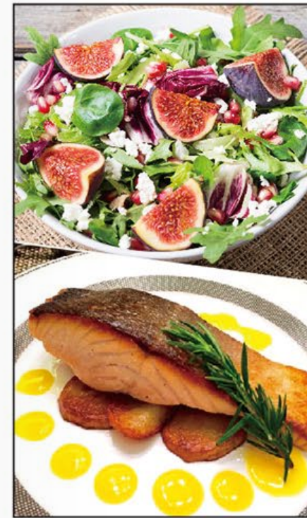
鮮果美食推介 Fresh Fruits Yummy Food