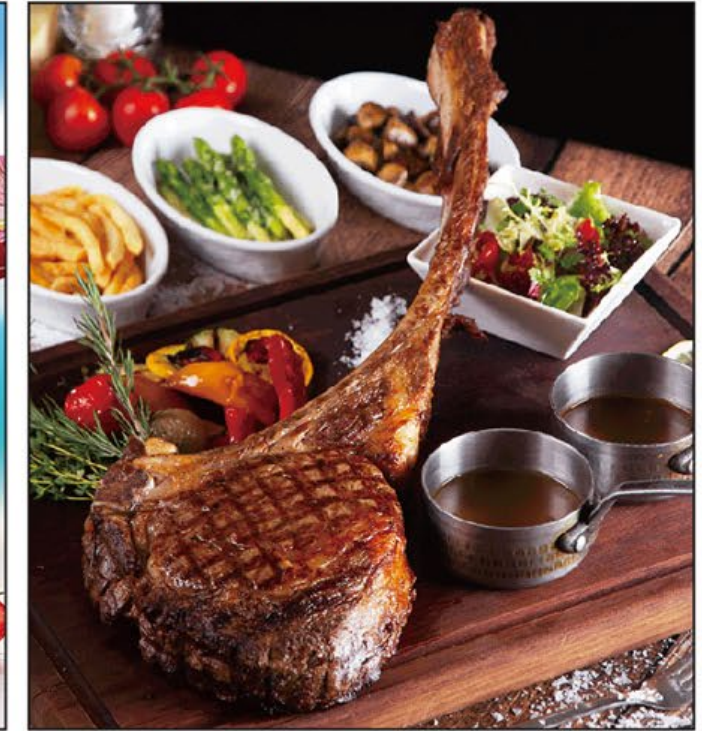
斧頭扒套餐 Tomahawk Steak Set