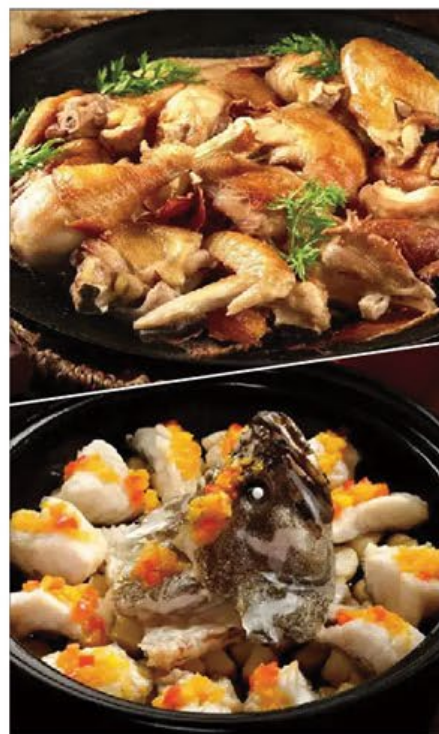
閩南風味篇 Minnan Cuisine

9月14至15日及17至18日 14 - 15 & 17 - 18 September