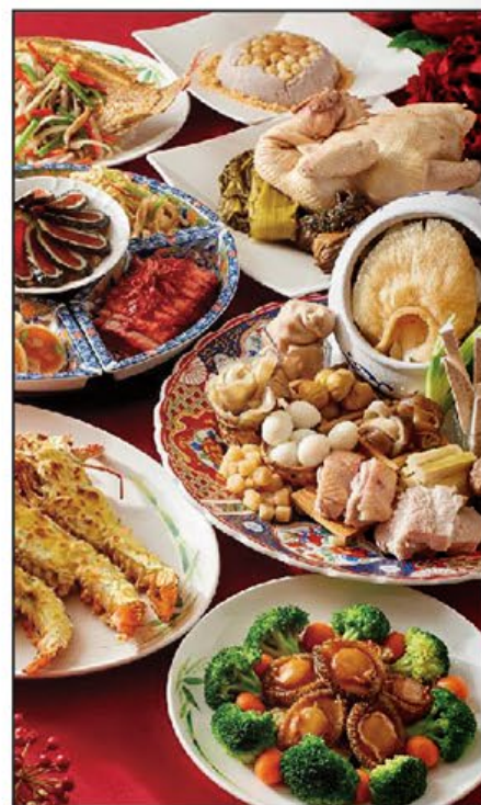
花好月圓套餐及小菜精選 Mid-Autumn Festival Recommendations

9月14至15日及17至18日 14 - 15 & 17 - 18 September