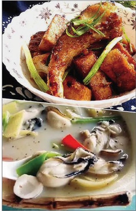
中山風味篇 Zhongshan Delicacies Delight